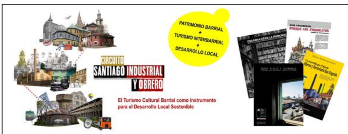
Imagen 7. Imagen promocional e insumos de investigación.

Finalmente, conviene poner atención a los siguientes aspectos propios del diseño de proyecto turístico que se describe; el control de las expectativas por parte de los actores locales involucrados, para viabilizar el éxito de la propuesta, hacerla sostenible en el tiempo y lograr que se convierta en una plataforma para proyectos futuros, que involucren un número mayor de recursos económicos e impacto positivo en el medio urbano.